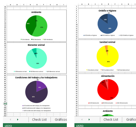
Ejemplos de los gráficos que brinda el software para análisis de datos de la Guía BPT: muestran el grado de cumplimiento de las Buenas Prácticas en el establecimiento en estudio, por etapa y por eje temático.